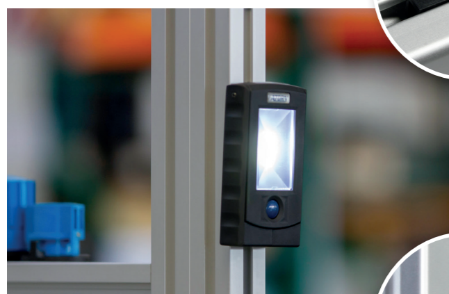
Zusätzliche Beleuchtungen anbringen