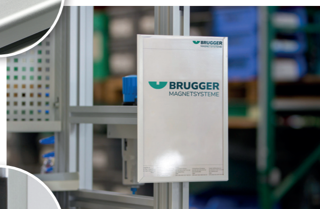
Dokumente oder Plakate anbringen