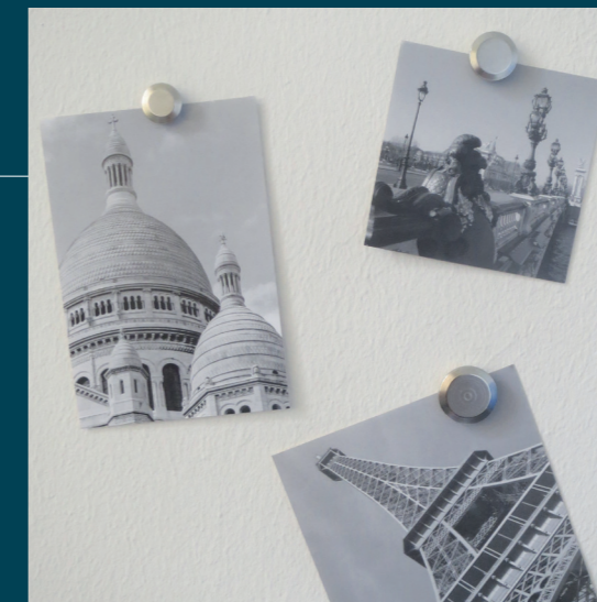
Extrastark - hält auch auf Magnetfarbe und -putz

Sie sind rund, vernickelt und haben die Fähigkeit, auch Luftspalte zu überbrücken. Das bedeutet, dass sie auch in Situationen, in denen ein kleiner Abstand zwischen dem Magneten und der Oberfläche besteht, eine starke Haftkraft aufrechterhalten können.