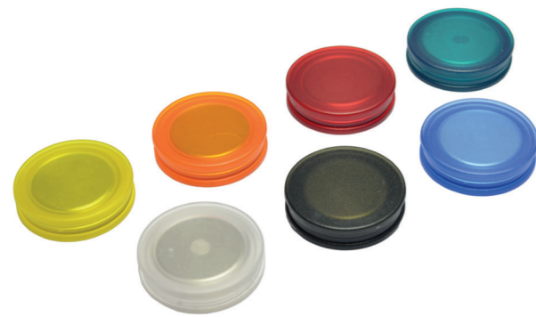
Extra starke Scheibenmagnete für Glasboards