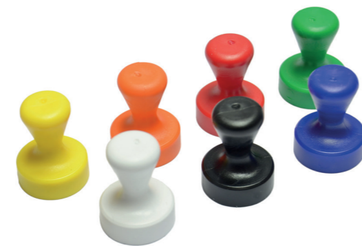
Starke Griffmagnete mit Kunststoffgehäuse