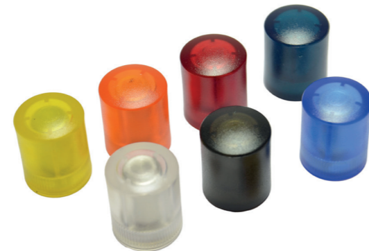
Starke Zylindermagnete für Whiteboards