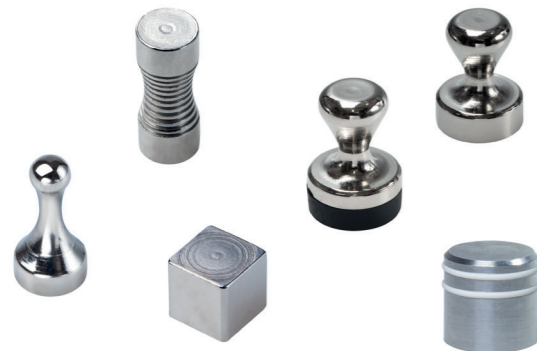
Starke Designmagnete in verschiedenen Formen