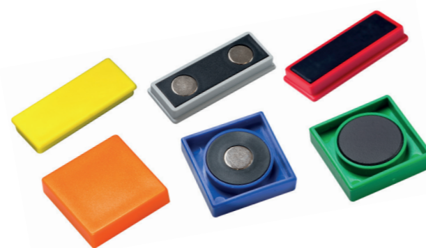
Auch rechteckig und quadratisch in verschiedenen Farben

Büromagnete nennt man jene Magnetsysteme, bei denen der Magnet einerseits seine klassische Funktion als Befestigung erfüllt und andererseits aufgrund seines ansprechenden Designs besonders in Sichtbereichen eingesetzt werden kann. Verwendung finden Organisationsmagnete beispielsweise in der Büro-Umgebung, in Schulen oder Schaukästen und an Kühlschränken.