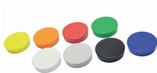
Runde Büromagnete in vielen Farben und Durchmessern